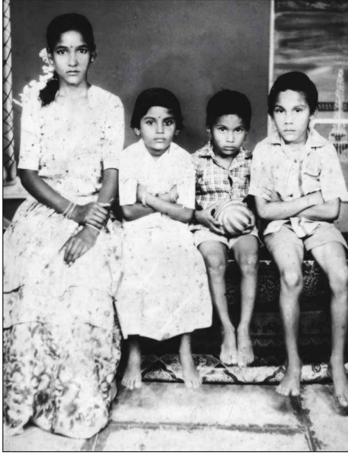
ఆంజళ్ళ, చైల్డ్రెన్, శ్రీమద్బుడ, నేను